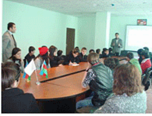
Lənkəran Gənclər Evinə Dəyirmi-masa

MAGİYA ictimai birliyinin tərəfdaş təşkilatların şagird və müəllim heyəti üçün keçirdiyi müxtəlif tədbirlər