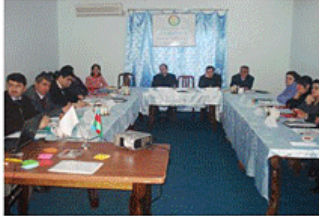
Dalğa otelində tərəfdaş təşkilatlar üçün görüş

“Maarifpərvərlik” Azərbaycan Gənclərinin İctimai Yardım Assosiasiyası (MAGİYA) İctimai birliyi