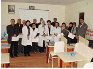
Uşaq evində təlim kursu