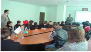
Lənkəran Gənclər Evinə Dəyirmi-masa

MAGİYA ictimai birliyinin tərəfdar təşkilatların şagird və müəllim heyəti üçün keçirdiyi müxtəlif tədbirlər