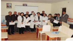
Uşaq evində təlim kursu