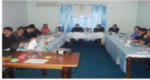
Dalğa otelində tərəfdar təşkilatlar üçün görüş

“Maarifpərvərlik” Azərbaycan Gənclərinin İctimai Yardım Assosiasiyası (MAGİYA) ictimai birliyi